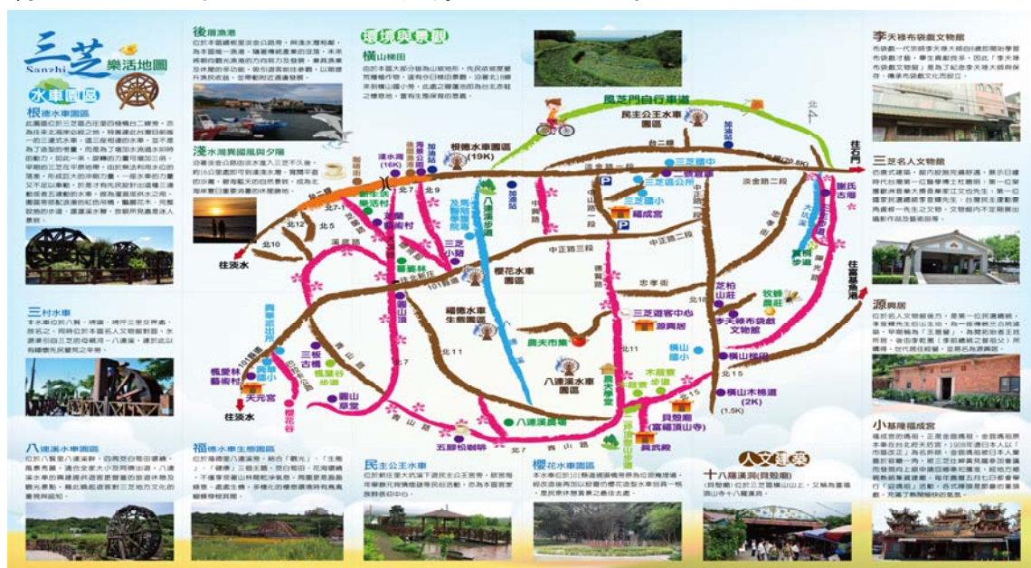
圖六、三芝觀光景點路線圖

每年公所會配合三芝特色辦理櫻花季、桐花祭、茭白筍節等各種活動，推銷農產品及促進觀光旅遊，以吸引更多遊客造訪三芝。