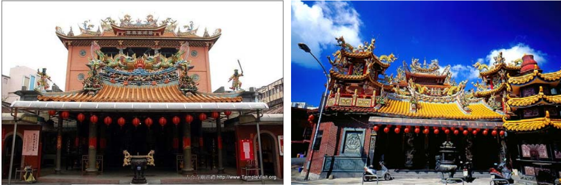
圖三、智成忠義宮、福成宮

宗教團體在本區辦理的文化事業概況，最明顯的有教會辦理的馬偕醫學院及專科學校，還有雙連安養院等，都帶給本區很大資源和方便。