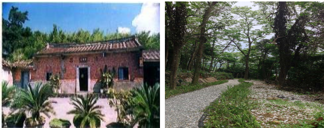
圖八、源興居、油桐花步道