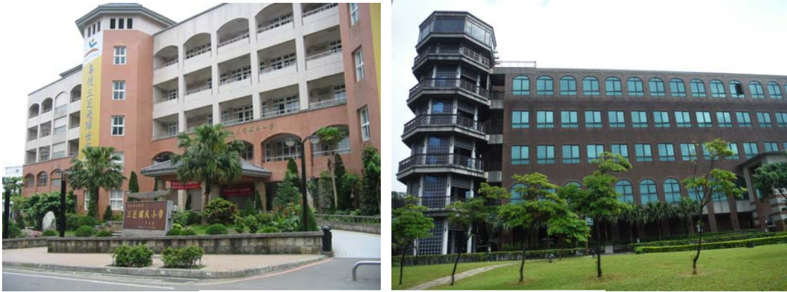
圖十、三芝國小、馬偕醫學院

本區境內設有 7 所幼兒園、1 所國中、3 所小學、1 所專科及 1 所大學，本區就推廣全民教育，落實在地就學已具備基礎條件，惟若能再具有高中職功能，更是豐富了本區教育資源。