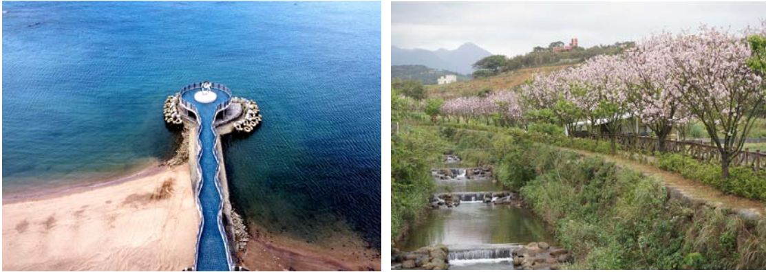
圖七、海上平臺、三生步道