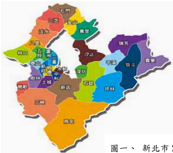
圖一、新北市 29 區行政區域圖

本區在行政區域劃分為八賢、埔頭、古庄、新庄、埔坪、茂長、橫山、錫板、後厝、福德、圓山、店子及興華，共 13 里 254 鄰，主要的行政、金融、商店街皆分布在埔頭及埔坪 2 里，人口數也最多，佔三芝區總人口數一半以上，本區佔地面積最大為圓山里，最小為茂長里。