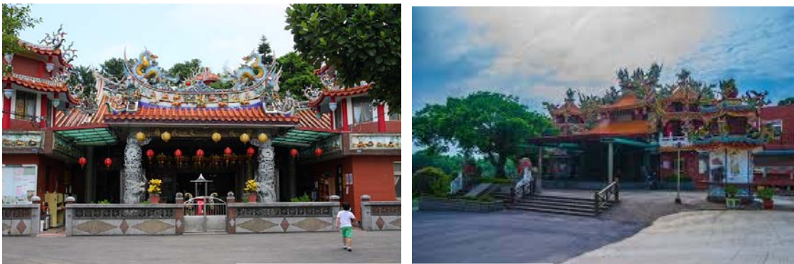
圖四、智成堂、八仙宮